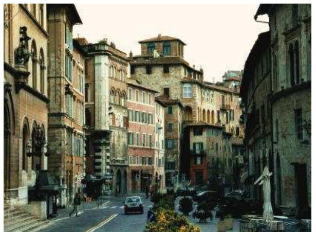
ペルージャの風景

この度、ペルージャ(イタリア)の建築団体から、青森支部との文化交流をしたいという申し出があり、お受けすることとなりました。