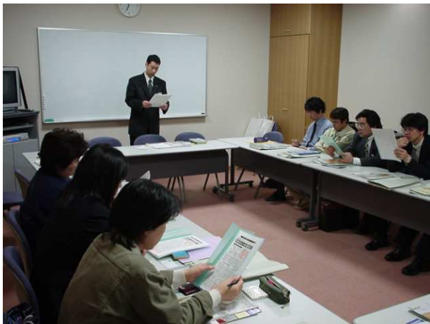
プチ商品説明会の様子

説明会についてのお問い合わせ・お申込みは支部事務局までお願いいたします。(無料)