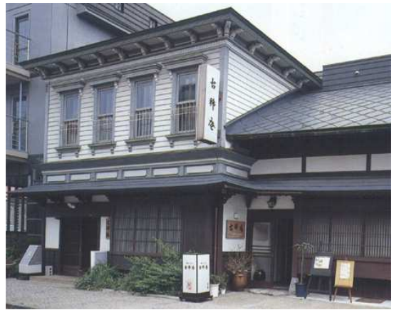
↑「旧渡辺商店」函館にある食事処。一階が和風で 二階が洋風で、盛美館と似ている。檜を贅沢に使っ た建物 竣工は明治 42 年。

皆さんもどうですか？充実した一日を送ることが できる海外旅行になりますよ。(farmer)