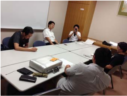
写真を撮り返されてしまいました。