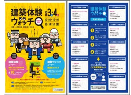
今年のチラシが完成！！