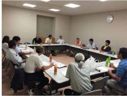
総勢17名での会議となりました。