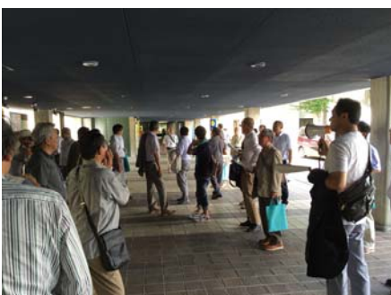
弘前市民会館ピロティ。