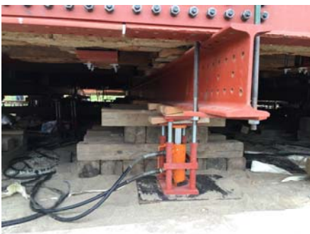
奇跡的に内部を見学できました！