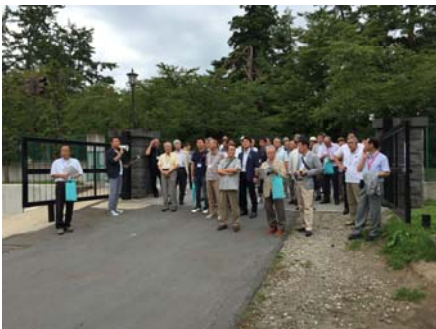
齋藤先生による説明の様子。