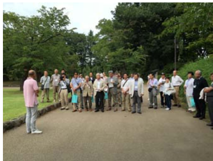
神さんによる説明の様子。