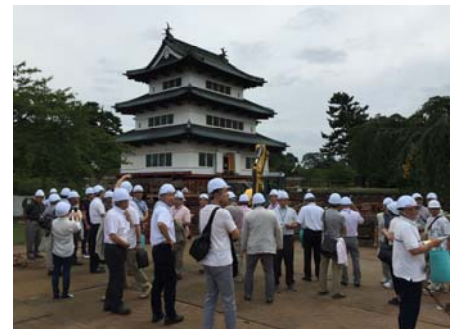
弘前城曳家工事の様子。