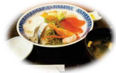
(昼食イメージ・ひろめ荘提供)

ご旅行条件書【要約】お申込みの際、必ず「国内募集型企画旅行条件書」を別途お受け取り頂き、ご確認の上、お申込みください。