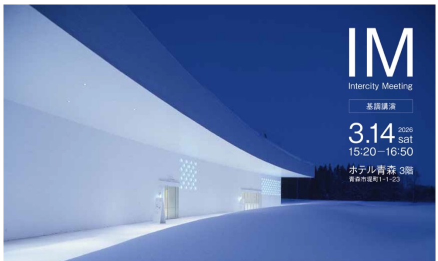
青木 淳 Jun AOKI

神奈川県生まれ。東京大学修士課程建築学修了。磯崎新アトリエを経て、1991年独立。手掛けた作品は、1997年に吉岡賞を受賞した住宅「S」をはじめ、1999年に日本建築学会賞を受賞した潟博物館などの公共施設や、ルイ・ヴィトンショップなどの商業施設など多岐にわたる。2005年には青森県立美術館、2020年には京都市京セラ美術館の改修設計にも携わり、現在同館の館長も務める。2025年第19回ヴェネチア・ビエンナーレ国際建築展日本館キュレーター。設計のみならず、新たな設計概念の構築や、建築・アート批評などの領域でも活躍されている。